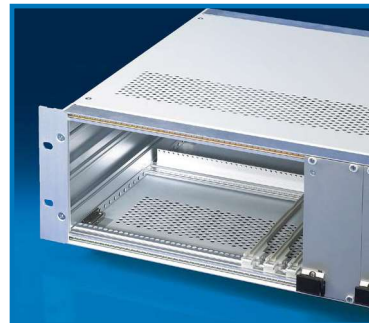
Фланец для 19" монтажа