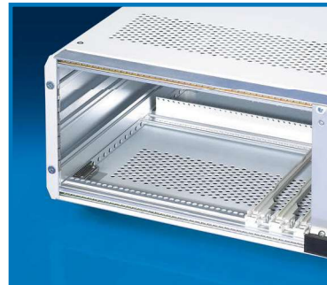
Использование в качестве настольного корпуса с угловыми панелями