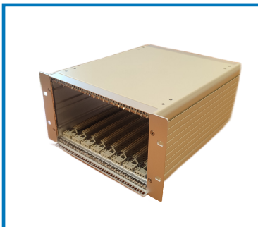
Внутренний монтаж из программы комплектующих HeiPac Vario