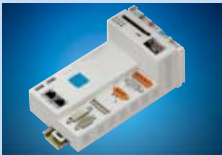
WAGO-I/O-IPC Компактный промышленный PC компьютер