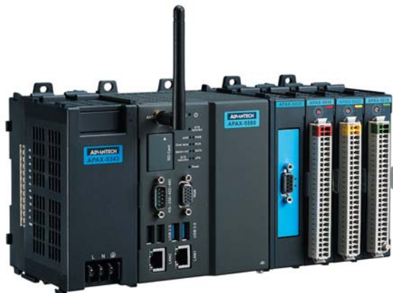
Рис. 1. APAX-5580

В основу системы лазерного позиционирования входит APAX-5580 (рис. 1) – управляющее вычислительное устройство с тремя модулями (APAX-5490, APAX-5046, APAX-5040), которое было подключено к устройству позиционного управления и реле безопасности. Для обеспечения беспроводного соединения с диспетчерским пунктом и EKI-5525, а также EKI-6331AN, эти устройства были подключены к APAX-5580. Сенсорный монитор IDS-3110 был установлен на внешней стороне системы лазерного наведения.