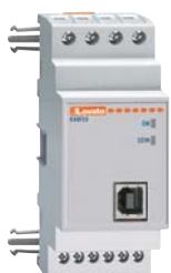
EXM 10 10