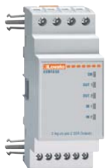
EXM 10 00